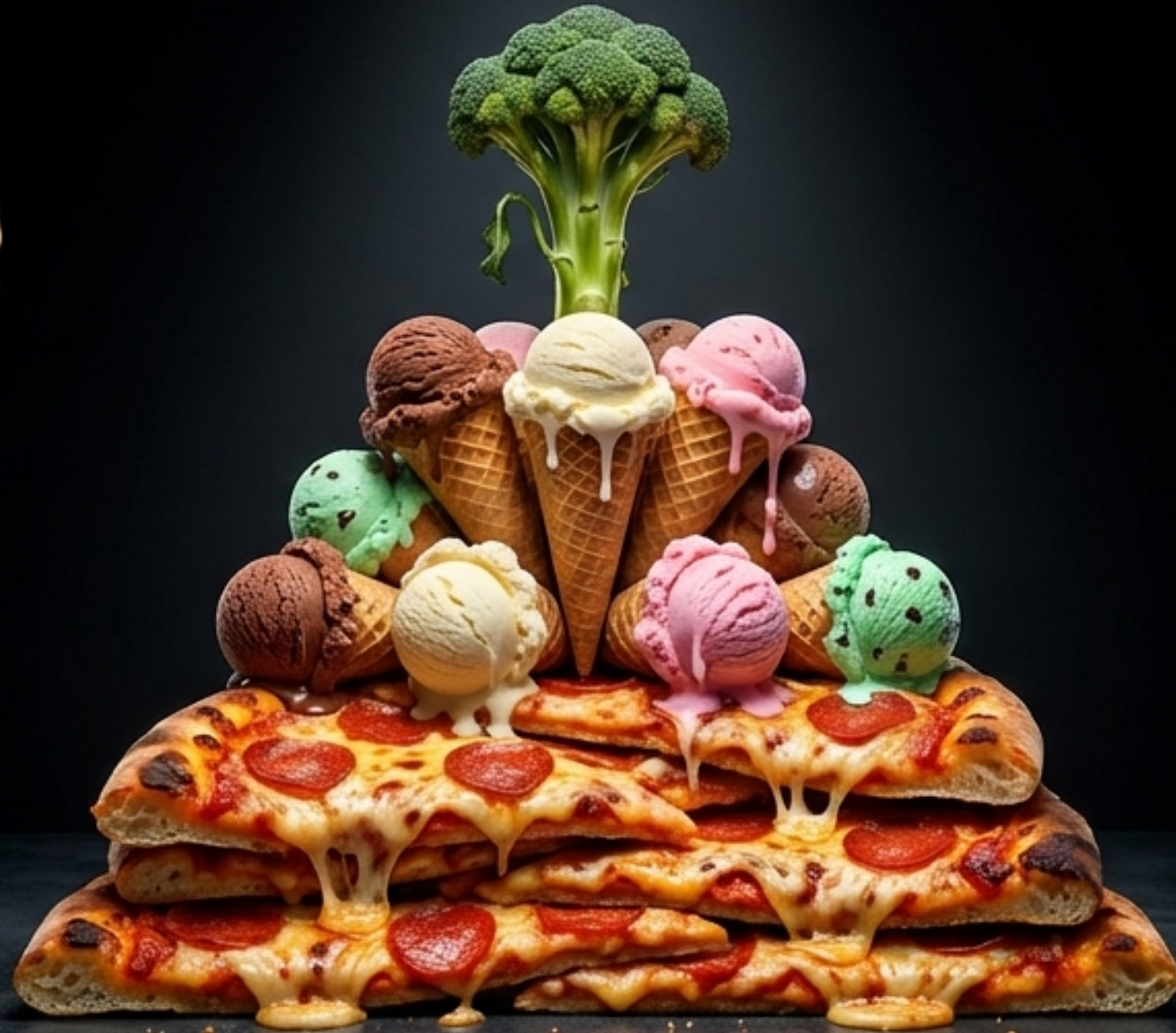
EXHIBIT F: CONFIDENCIAL