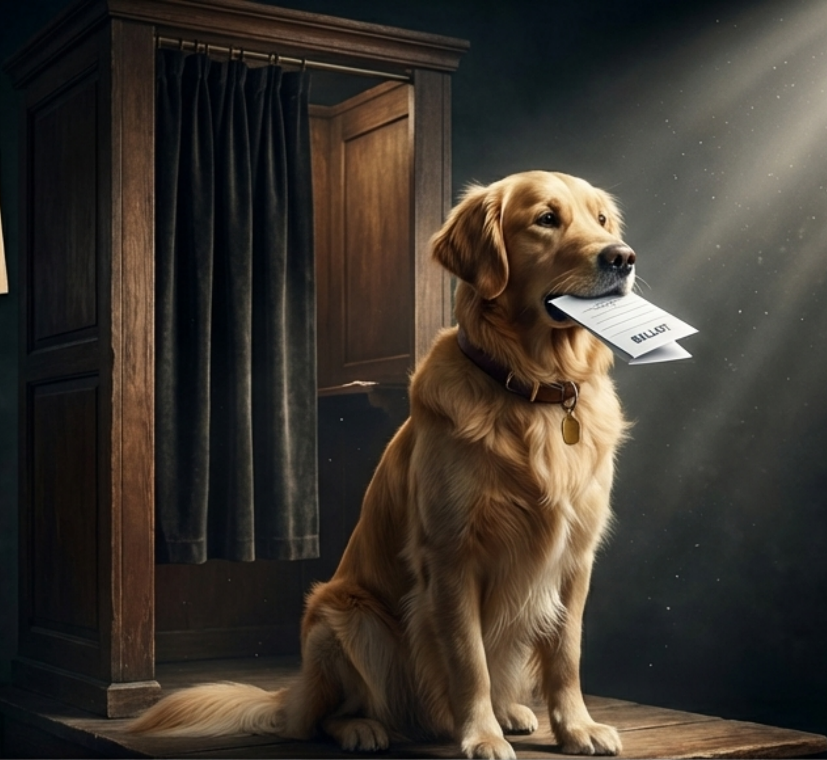
EXHIBIT C: CONFIDENCIAL